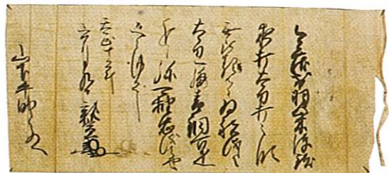
三村親宣感状(本館蔵)