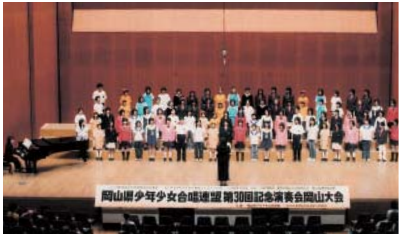
▲各団代表者によるトップコンサート

参加団体が例年より多かったことは嬉しい。少人数の合唱団も参加し熱心な演奏発表をした。各団とも団員数に応じた選曲・演出で熱演した。