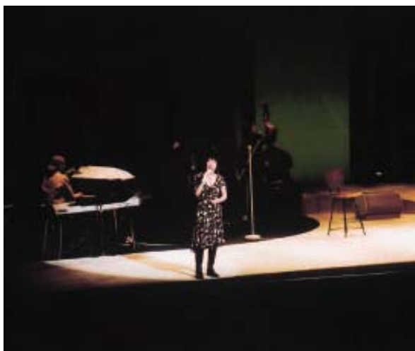
▲森山良子コンサート