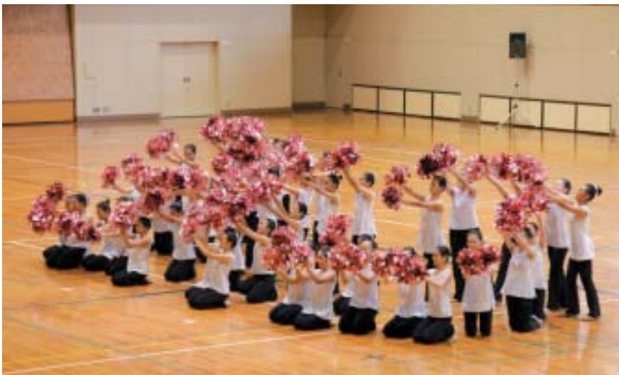
▲エキシビジョン 岡山県合同バトンチーム