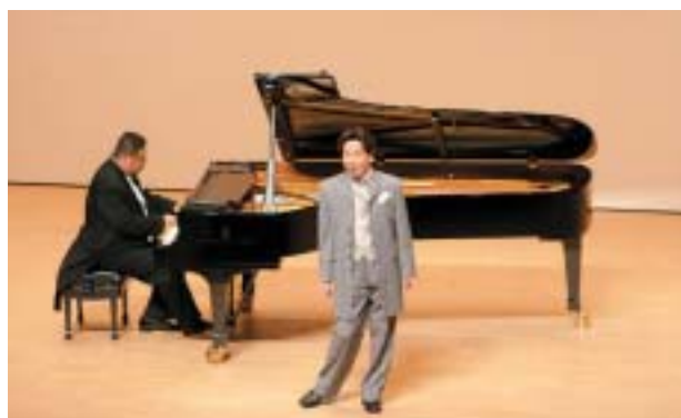
▲錦織健テノールリサイタル

おかやま県民文化祭優秀公演招へい事業及びおかやま音楽祭提携公演に決定したことにより、効果的な広報・PR活動等新たな事業展開ができた。