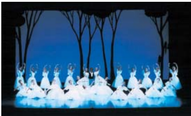
▲レ・シルフィード