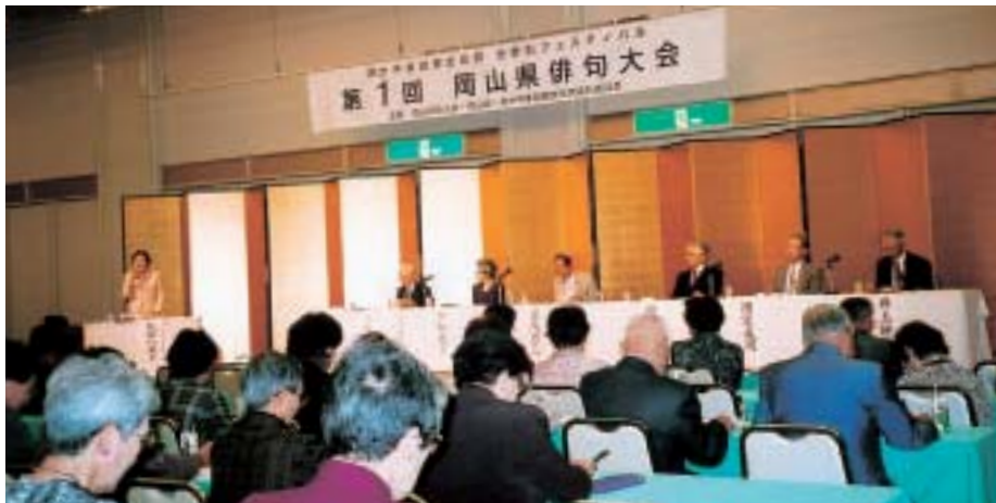
▲シンポジウム「岡山の俳句」

岡山県で最初の全県単位の俳句組織を発足させることができた。県内における俳句文芸の振興と懇親の場づくりと、その意識化を図ることができた。