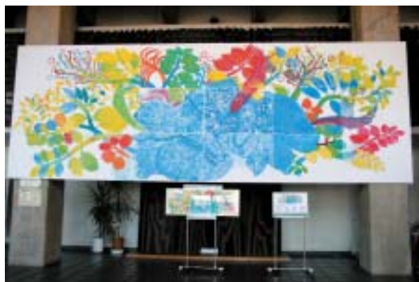
▲幼児の手形で作るハートフルモニュメント