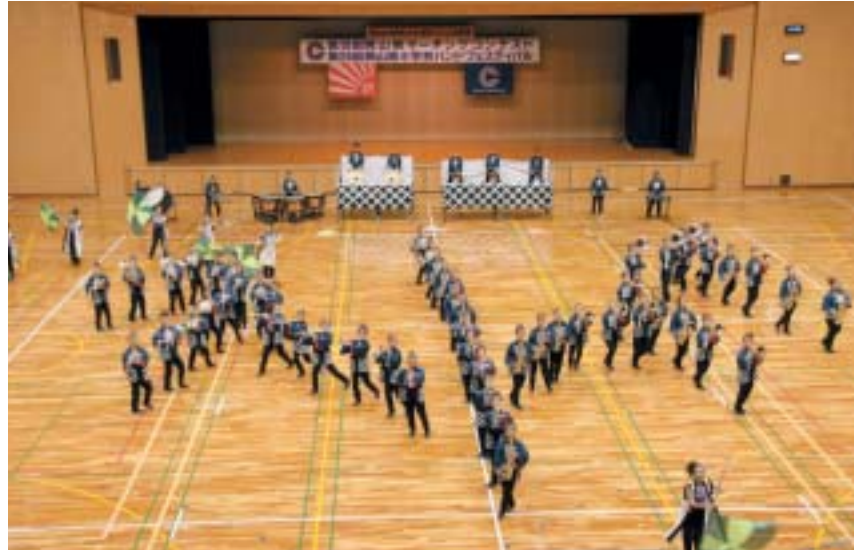
▲岡山県立倉敷商業高等学校

岡山県大会は18回目を迎え吹奏楽行事として多くの入場者があった。教育活動の一環として大切な位置づけにあると共に、生涯教育への効果も十分に期待できる大会であると考えます。今後とも吹奏楽の発展普及に邁進し、教育文化県岡山を名実共に実証する大会を目指したい。