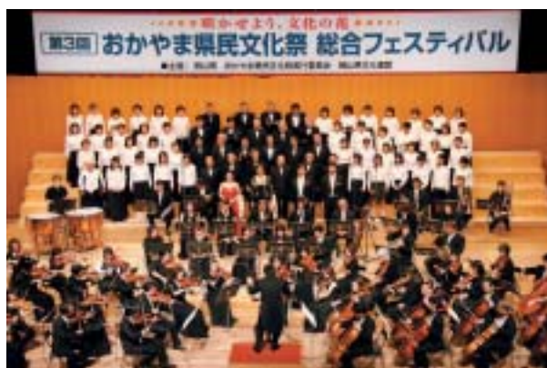
▲ベートーヴェン第9交響曲第4楽章