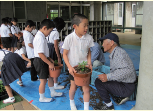
ボランティアと一緒に一人一鉢菊いっぱい運動 (美咲町立旭小学校)

地域住民がボランティアとして学校に入り、学習支援や学校行事等の支援、環境整備活動など幅広く活動しています。