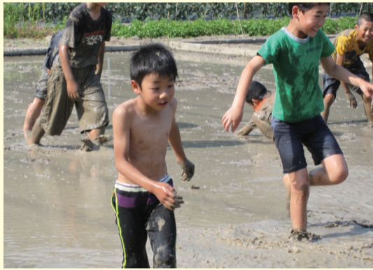
教室近くの田んぼで泥んこ遊び (総社市わくわく温羅クラブ昭和)

放課後や週末、長期休業中における体験活動、交流活動が地域の実情に応じて提供されています。