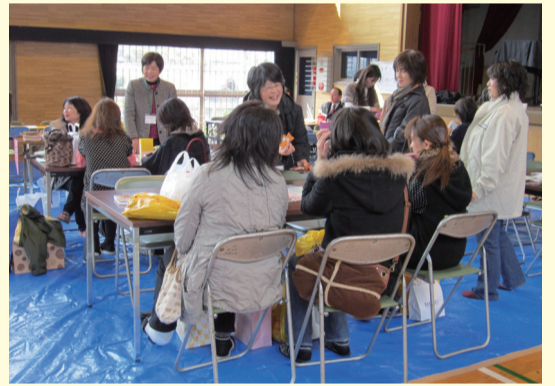
玉野市家庭教育支援チーム員による子育て情報の提供 (玉野市立日比小学校)