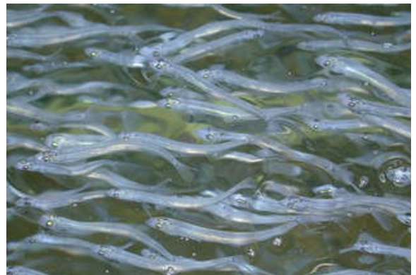
写真2 飼育中の稚魚（全長約40mm）