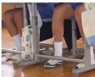
足の裏を床にべったりつけて