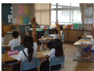
挙手は右手をのばして