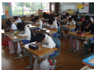
暗算テストの取り組んでいる様子。決められたタイムで実施