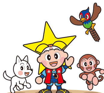
岡山県マスコットももっちと仲間たち