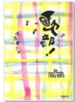
『吹部！』 著 赤澤竜也 飛鳥新社

『楽隊のうさぎ』も、初めて吹奏楽に出会った男子中学生の心情の変化と成長を細やかに追っています。一方、『船に乗れ』は、本格的にチェロを学ぶ男子高校生が主人公。挫折や恋や葛藤も描かれ、生き方や人生についても考えさせられる三部作です。『吹部！』では、弱小高校吹奏楽部が、全国コンクール金賞を目指します！ いずれの本からも、楽器演奏の難しさと楽しさが伝わります。