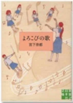
『よろこびの歌』 著 宮下奈都 実業之日本社