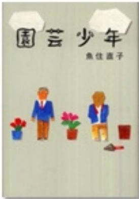
『園芸少年』 著 魚住直子 講談社