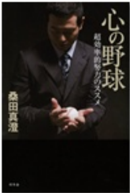
『心の野球 超効率的努力のススメ』 著 桑田真澄 幻冬舎