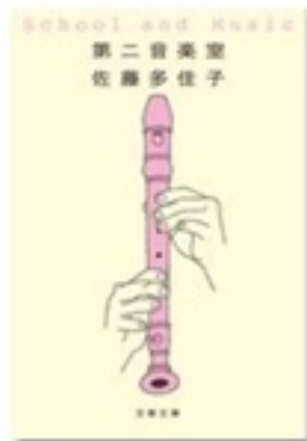
『第二音楽室』 著 佐藤多佳子 文藝春秋