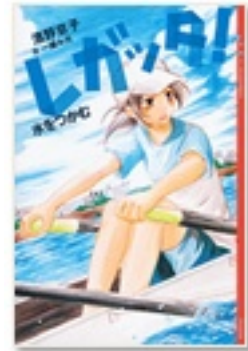
『レガッタ! 1 水をつかむ』 著 濱野京子 講談社

『快晴フライング』は、主将の事故死によって存続危機に陥った、進学校水泳部の物語です。立ち上げ部員、頑張れ中三生！と声をかけたくなります。『空をつかむまで』は、中三トリオがトライアスロンに挑戦する、爽やかな青春ストーリー。坪田譲治文学賞受賞作です。『レガッタ! ー水をつかむー』では、女子高校生がボート部で猛奮闘！ その奮闘ぶりに、思わず拍手してしまうかも。