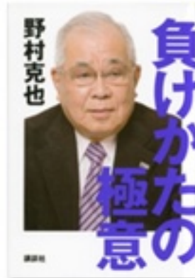
『負けかたの極意』 著 野村克也 講談社