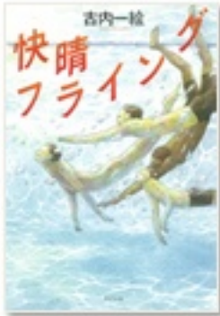
『快晴フライング』 著 古内一絵 ポプラ社