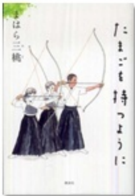
『たまごを持つように』 著 まはら三桃 講談社