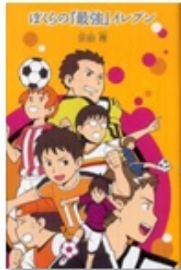
『ぼくらの『最強』イレブン』 作 赤田理 ポプラ社