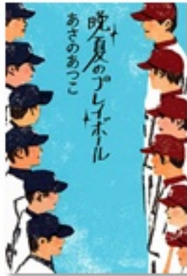
『晩夏のプレイボール』 著 あさのあつこ 毎日新聞社刊