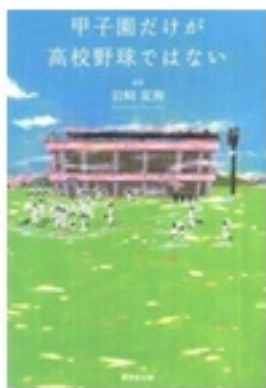
『甲子園だけが高校野球ではない』 監修 岩崎夏海 廣済堂出版