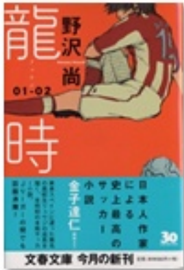
『龍時 01-02』 著 野沢尚 文藝春秋