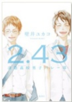
『2.43 清陰高校男子バレー部』 著 壁井ユカコ 集英社