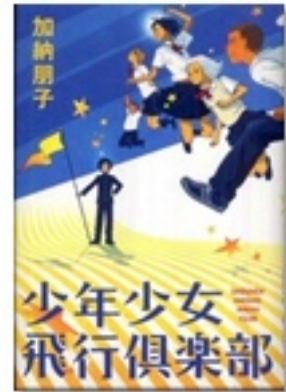
『少年少女飛行倶楽部』 著 加納朋子 文藝春秋

『園芸少年』では、帰宅部希望の主人公と、元不良に相談室登校という、個性的な男子高校生三人が、植物に熱くなっていきます。コミック『弱虫ペダル』では、オタク高校生が自転車の才能を开花させていき、『少年少女飛行倶楽部』では、女子中学生が、「飛行クラブ」でピーターパンを目指します？！どんな部活動なのかは、読んでのお楽しみです。