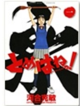
『とめはねっ！ 1 鈴里高校書道部』（コミック） 著 河合克敏 小学館

『花の道は嵐の道』は、高校華道部の男女新入部員が茶道部と対決する、コミカルな作品です。『小説ちはやふる』は、もちろん競技カルタ。マンガには出てこない、主人公達の中学生時代が舞台です。そして書道部が舞台となるのが、コミック『とめはねっ！』。なんと柔道で活躍してきた少女が、書道の魅力に開眼します。