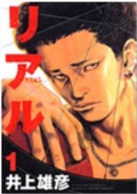
『リアル 1』(コミック) 著 井上雄彦 © I. T. Planning, Inc.