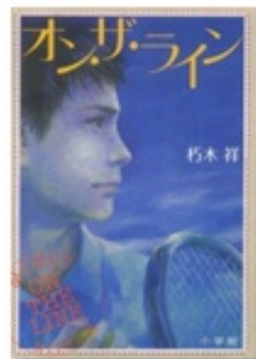
『オン・ザ・ライン』 著 朽木祥 小学館

同じ目標を目指す仲間がいるからこそ、ぶつかるし、また頑張れる。『2.43』は、バレーボール命の、オレ様キャラ灰島が、チームメイトとぶつかりながら成長する物語。タイトルの“2.43”は、男子バレーのネットの高さ(2.43m)のこと。コミックの『ハイキュー』もバレーボール(排球)のこと。オシャレでしょ？ 『オン・ザ・ライン』は、テニスに打ち込む高校生が主人公。友情の下にひそむコンプレックスなど、主人公の心の葛藤は、読みごたえ充分です。