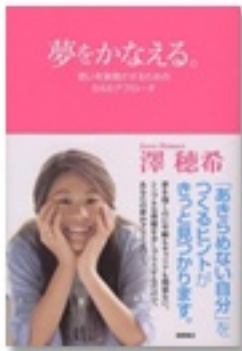
『夢をかなえる。 一思いを実現させるための64のアプローチ』 著 澤穂希 徳間書店