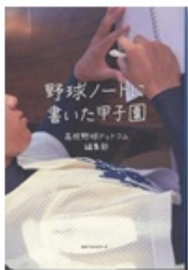
『野球ノートに書いた甲子園』 著 高校野球ドットコム編集部 ベストセラーズ