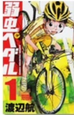
『弱虫ペダル 1』（コミック） 著 渡辺航 秋田書店