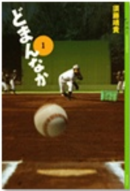
『どまんなか 1』 著 須藤靖貴 講談社