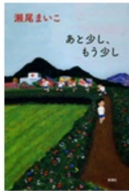
『あと少し、もう少し』 著 瀬尾まいこ 新潮社