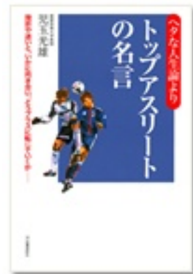
『ヘタな人生論よりトップアスリートの名言 挫折や迷いと、いかに向き合い、どうプラスに転じていくか』 著 児玉光雄 河出書房新社発行

前田選手の『エースの覚悟』、元巨人軍投手、桑田選手の『心の野球』。名将、野村監督の『負けかたの極意』。努力と経験に裏打ちされた言葉にはいずれも重みがあります。『ヘタな人生論よりトップアスリートの名言』には、イチローやマー君（田中将大）や、いろいろな競技の一流アスリート12人の名言が載っています。スポーツを極めた人の言葉に耳を傾けてみませんか？