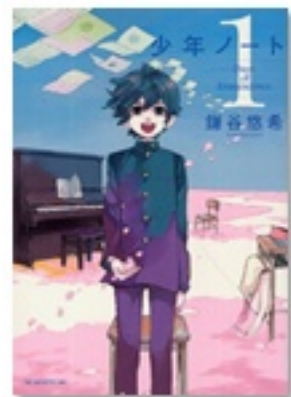
『少年ノート 1』(コミック) 著 鎌谷悠希 講談社

歌には、心を一につにさせる不思議な力があるのかもしれませんがね。『よろこびの歌』の女子高校生は、合唱によって再び希望を見出します。『第二音楽室』は、合唱をはじめ、学校を舞台にした音楽をめぐる短編集です。また、天性のボーイソプラノを持つ少年が、中学合唱部で成長するコミック。『少年ノート』も、歌の魅力がたっぷりです。