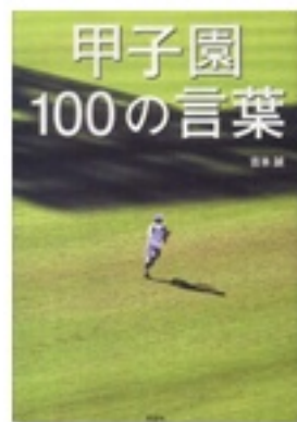
『甲子園 100の言葉』 著 吉本誠 彩図社

毎年、熱闘が繰り広げられる「甲子園」。行けても行けなくても、目指して頑張ればこそ起きるドラマがあり、手に入る何かがあるのでは？ 『野球ノートに書いた甲子園』の球児たちの野球日誌、『甲子園だけが高校野球ではない』に集められた、高校生の21のエピソード。名勝負のウラで語られた『甲子園 100の言葉』の、選手や監督たちの名セリフ。そこから、その「何か」が見えてくるかもしれません。