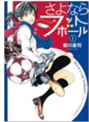
『さよならフットボール 1』(コミック) 著 新川直司 講談社

『龍時』（全3巻）は、サッカーのために、たった一人で海を渡る16歳の少年リュウジの物語です。舞台がプロサッカーへと広がり、読み応えがあります！そして、サッカー留学から戻ってきた少年が活躍するのが、『ぼくらの『最強』イレブン』。ご存知、「ぼくら」シリーズの一冊。高校生になった彼らが、高校サッカー部の立て直しに奔走します。コミック『さよならフットボール』は、男子部員に混じって奮闘する、中学生のサッカー女子が主人公です。