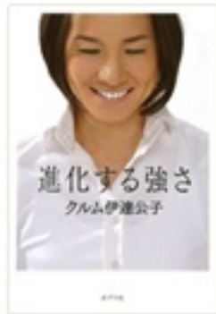
『進化する強さ』 著 クルム伊達公子 ポプラ社