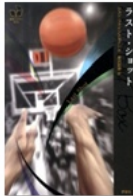
『ラスト★ショット』 作 ジョン・ファインスタイン 訳 唐沢則幸 評論社