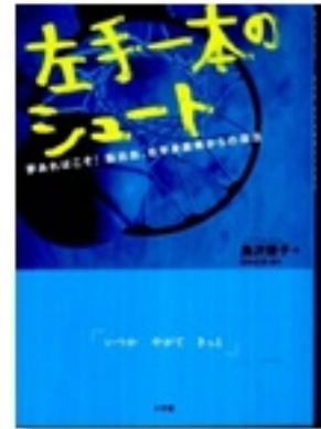
『左手一本のシュート』 夢あればこそ！ 脳出血、右半身麻痺からの復活』 著 島沢優子 小学館

車椅子バスケット『リアル』も、熱いですよね！一年に一度の発刊に首を長くしている人も多いかもしれません。待っている間に、バスケットを舞台にしたミステリー『ラスト★ショット』はいかがでしょうか？中学生の男女コンビが事件解決に大活躍、ドキドキしますよ。『左手一本のシュート』は、ノンフィクションです。突然病に襲われた、県下No.1のバスケット選手田中君が、三年後、麻痺の残る身体で試合のコートに立つまでの実話です。