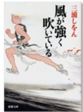
『風が強く吹いている』 著 三浦しをん 新潮社

いろいろな事と葛藤しながら、スポーツに打ち込む登場人物たちの姿には、つい胸が熱くなります。『走る少女』は短距離に、『あと少し、もう少し』では駅伝に、それぞれ打ち込む中学生の姿が描かれています。『風が強く吹いている』は駅伝に青春する大学生が主人公です。彼らの走る息づかい、躍動する体、そしてそこにある繊細でしなやかなハートを感じてください。