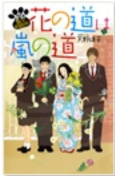
『花の道は嵐の道 タマの猫又相談所』 著 天野頰子 ポプラ社