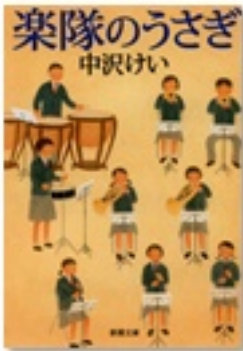
『楽隊のうさぎ』 著 中沢けい 新潮社