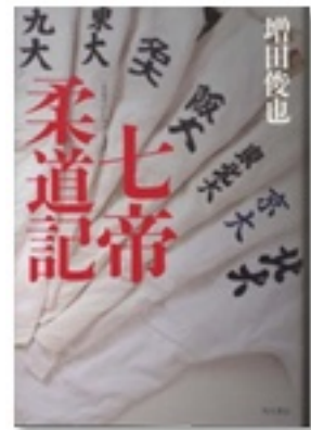
『七帝柔道記』 著 増田俊也 角川書店

剣道をはじめ弓道や相撲など、武道と呼ばれる競技は、鍛錬を通じて人格の完成をめざす人間形成の道といわれています。「武士道」シリーズは剣道で、『たまごを持つように』は弓道で、『セキタン!』は相撲で、技と心を磨く熱い中高生が描かれています。そして特殊な柔道、七帝柔道で己の限界に挑む大学生が描かれるのが『七帝柔道記』。武道の魅力と彼らの成長が、同時に伝わってきますよ！