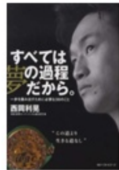
『すべては夢の過程だから。 一歩を踏み出すために必要な36のこと』 著 西岡利晃 ベストセラーズ

どの本も、それぞれ夢や思いを実現させるワザが満載です。サッカーの川島選手をはじめ、澤選手、テニスのクルム伊達選手、ボクシングの西岡選手が、失敗や挫折、怪我から学びつかみとった本物の「ワザ」にはとても説得力があります。読むと、自分も頑張ってみようかな、という気持ちになります。