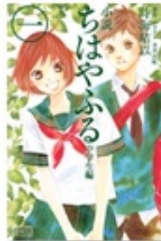
『小説ちはやふる 中学生編 1』 著 時海結以 原作・イラスト 末次由紀 講談社