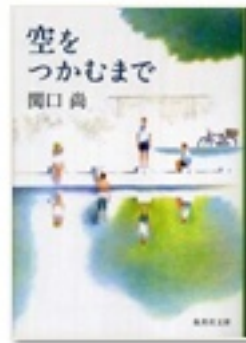
『空をつかむまで』 著 関口尚 集英社