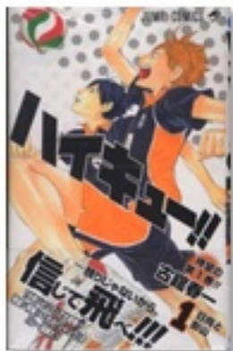
『ハイキュー!! 1 日向と影山』(コミック) 著 古舘春一 集英社