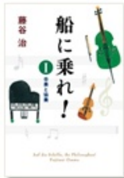
『船に乗れ！ 1 合奏と協奏』 著 藤谷治 ポプラ社刊