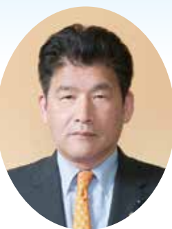
岡山県議会議長 小野 泰弘 【自民 総社市選出】

岡山県議会は、県内19の地域から選ばれた55名の議員で構成され、行政に対するチェック機能を果たすとともに、県政における最終的な意思決定機関としての役割を担っております。私は議員を志したときから、忠誠心を信条にしております。郷土岡山のため、県民の皆様のために誠意を尽くす気持ちをお忘れず、皆様の立場に立ち、皆様の声を県政に届け、県民福祉の向上と県勢の発展に努めてまいります。