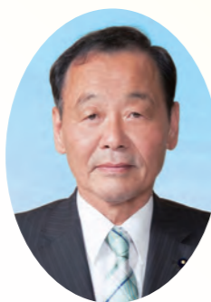
岡山県議会議長 井元 乾一郎 (自民 津山市・吉田郡・勝田郡選出)

岡山県議会は、県内19の地域から選ばれた54名の議員で構成され、行政に対するチェック機能を果たすとともに、県政における最終的な意思決定機関としての役割を担っております。私は、「政治は人づくり」を信条としています。「人こそが本県の財産であり、県の未来を明るくする力は、人を育てる教育ほかから考えられます。また、「一人が地域に定住し活躍するためには、産業を振興し雇用を創出する必要があります。人づくりを進め地域の活力を維持するため、本県の重要施策である教育の再生と産業の振興を全力で推進してまいります所存です。」