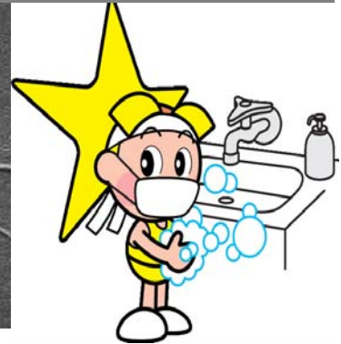
「岡山県マスコット ももっち」