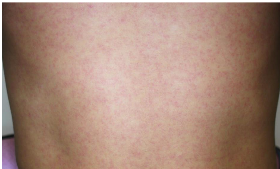
図3. ジカウイルス病の斑状丘疹様の発疹

潜伏期間は、2～12日（多くは2～7日）である。ジカウイルス病の臨床症状は多彩であるが、斑状丘疹様の発疹（ 図3 ）は90～100%に認められるのに対して、発熱の頻度は35～65%とされている 25,45,46 。また発疹は掻痒感を伴うことが多いとされている。また、大半の症例は入院を必要としなかった。 表7 に2015年のブラジル・リオデジャネイロにおけるジカウイルス病患者が発症後4日以内に認めた臨床症状を示す 45 。