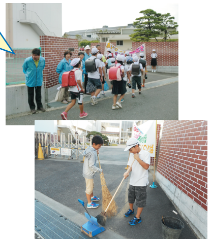
【あいさつ運動・校門清掃】