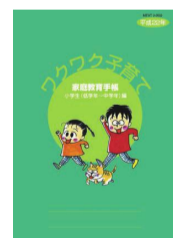
【小学生(低学年~中学年)編】

家庭教育手帳は、親子の絆を深め、心豊かな子どもを育てていくことを応援するために作られました。家庭での教育やしつけに関して、それぞれの家庭で考え、実行していただきたいことが書かれています。