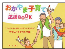
【グランパ&グランマ編】

※おかやま子育て応援BOOKは、県保健福祉部子ども未来課のHPからダウンロードできます。