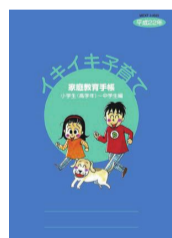
【小学生(高学年)~中学生編】