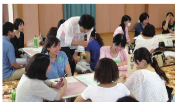
グループの中で話し合った上手な叱り方を全体で紹介しました。