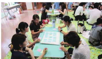
エピソードをもとに、上手な叱り方について意見を出し合いました。