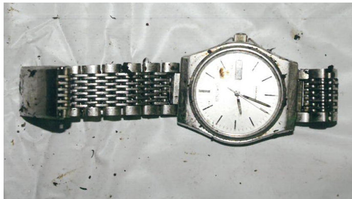
腕時計(丸型、三針、金属バンド)

お問い合わせ先:岡山県警察本部鑑識課指紋資料係 代表電話:086-234-0110 内線701-325~327