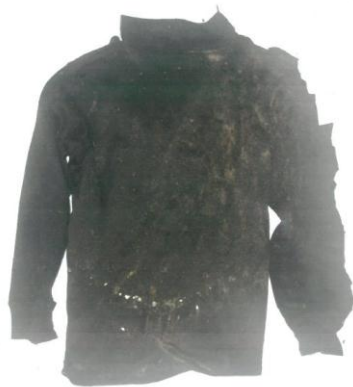
黒色ハイネックシャツ