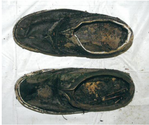
黒色デッキシューズ