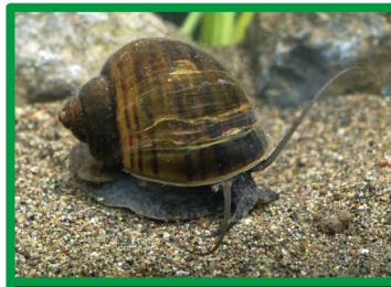
スクミリンゴガイ