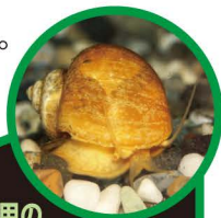
かんしょう用の ゴールデンアップルスネール

つかまえても、他の場所に持って行かないでね。飼っている貝は、池や川に放さないでね。