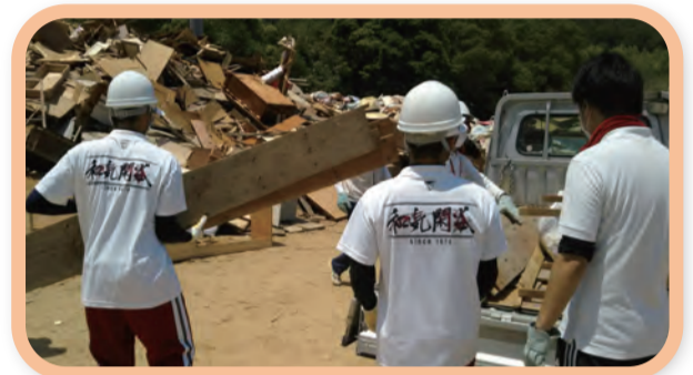
① 被災地での災害ゴミ撤去活動(県立和気閑谷高等学校)