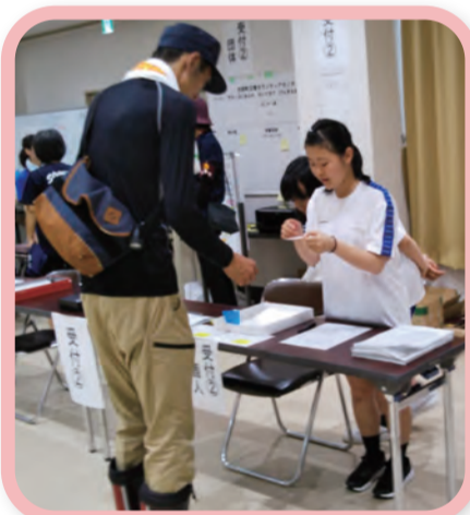
① 災害ボランティアの受付(県立矢掛高等学校)