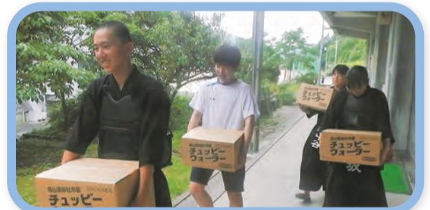
① 支援物資を被災地に届ける活動(県立瀬戸高等学校)