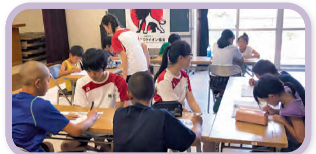
① 小・中学生への学習支援(県立総社南高等学校)