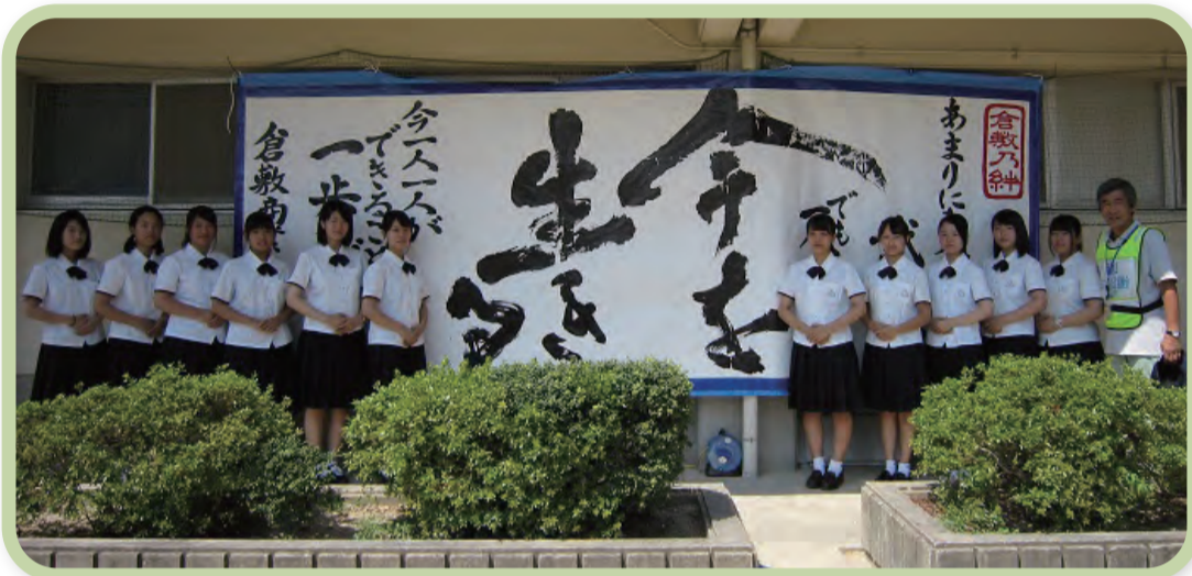
① 書道作品を避難所に提供(県立倉敷商業高等学校)