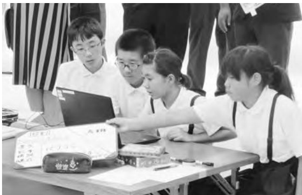
プログラミング学習による学び合い

新学習指導要領でも求められている確かな学力を育成するために、プログラミング的思考力や表現力の向上を目指した授業改善を行いました。まず、児童の発達段階に応じたICT機器の技能習得のため、情報活用能力についての系統表を作成しました。それによって、学年ごとに見通しをもって指導を行うことができました。次に、5・6年生は、新見市ソフトバンク社会貢献事業に参加し、人型ロボットPepperを活用したプログラ