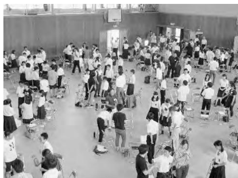
荘内中学校で行った「だっぴ」