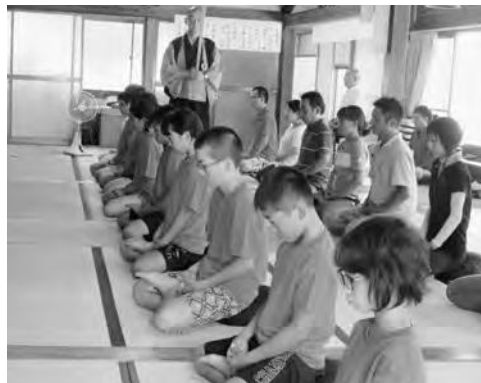
地域のお寺での坐禅

5・6年生児童を対象に、学校運営協議会(CS)の活動として「あら塩っ子宿泊体験(1泊2日)」を実施しました。ふるさとの自然や産業文化を生かした豊かな体験活動を通して、何事にも積極的に取り組み、たくましく生きる新砥っ子の育成を図ることを目的としています。