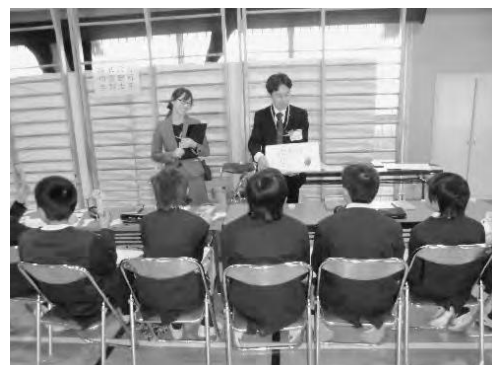
職業体験フェスタで銀行員からの説明を聞く児童