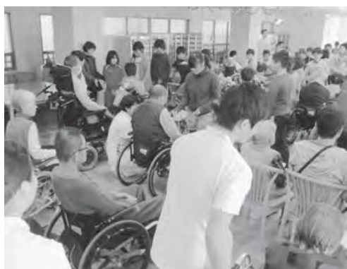
入院患者との交流

1 はじめに 本校は、全校児童67名の小規模校です。20年前に吉備高原都市の中に建設された小学校です。本校の取組の概要を紹介します。