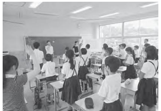
中学校「学びの時間」（英語）