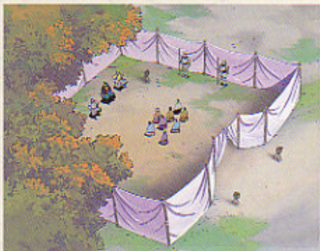
役人との話し合い