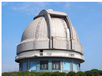
国立天文台188cm望遠鏡ドーム(浅口市)

※プレゼントのご応募にあたり記載いただく氏名などの情報(以下まとめて「個人情報」)は、法的業務を伴う開示請求を受けた場合を除き、当選者への商品の送付以外の目的には使用いたしません。第三者が個人情報に不当に触れることのないように、合理的な範囲内で厳重に管理いたします。個人情報の訂正・変更・そのほかのご連絡は「オセロ編集室」までお寄せください。