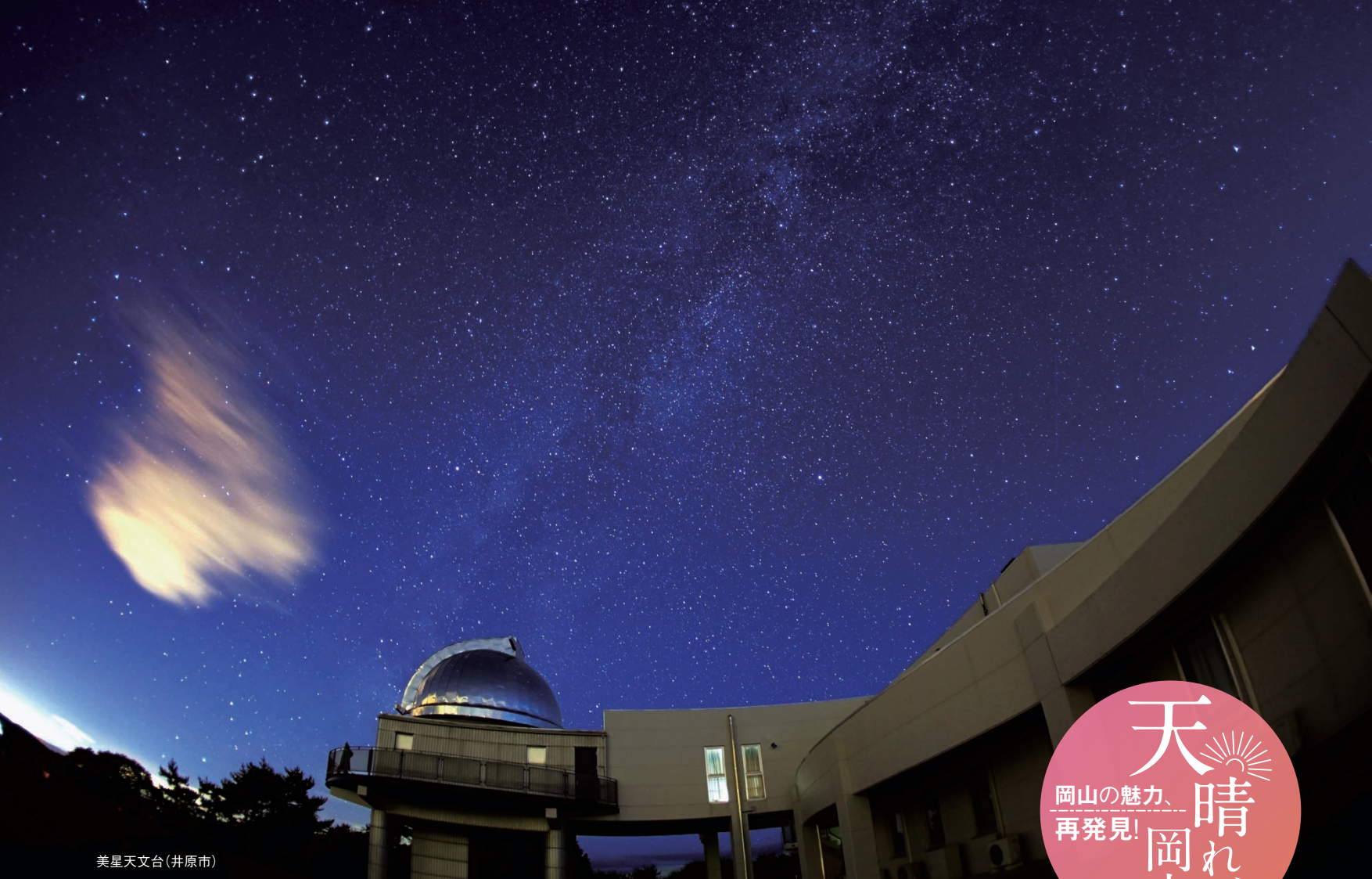
美星天文台(井原市)