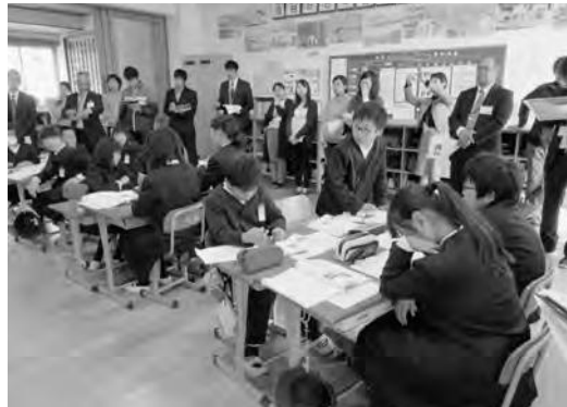
公開授業研究会の様子

校内研究は、研究教科を国語とし、教員全員による「めざす児童像」の共有と一人年1回以上の研究授業の実施、「板書記録一覧」による授業イメージの共有などを行いました。