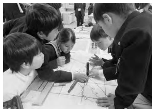
探究的な学習の中で、台風の進路を予測し、災害への対策を考える様子

の構成概念と、7つの能力・態度と、新学習指導要領の3つの柱（個別の知識・技能、思考力・判断力等、学びに向かう力・人間性等）との整理を行い、付けたい力を明確にした「単元学習プログラム」を各学年で作成するとともに、幼稚園・中学校との校種を越えた連携カリキュラムも作成しました。