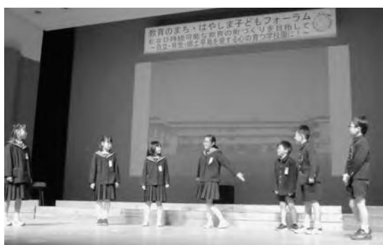
子どもフォーラムでIGUSAのよさを劇で紹介している様子

身に付けたい力を明確にした指導を行ったことで、児童・生徒の探究への意欲が向上し、地域へ愛着をもつことができました。また、地域に向けて発信したことで、町民の方々にも様々な形で児童・生徒に関わっていただくことができ、児童・生徒のがんばる姿を届けられました。今後は、SDGsとESDとの関係性を明確化し、小学校での学びを活かした中学校での力リキュラムの再構築を行ったり、教師の指導力向上を図ったりすることで、児童・生徒の「主体的・対話的で深い学び」を実現していきたいと思えます。