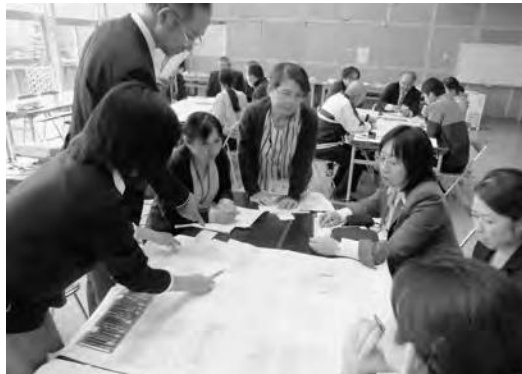
公開授業研究会での研究協議の様子

2年間、「魅力ある授業づくり徹底事業」の指定を受け、指導主事の指導助言や授業改革推進員の指導を積極的に受けました。