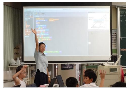
SOZANワクワクフリー塾 2019 小学生と一緒に活動

本校は今年度で開校18年目を迎えました。開校当初より、どのように時代が変化してもたくましく生きていける生徒の育成を目指して、総合的な学習の時間を「未来航路プロジェクト」と名付けて課題追究学習を行っています。