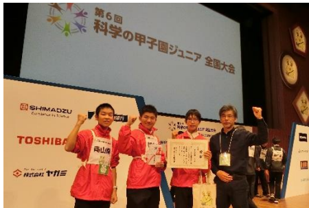
理系コンテスト 科学の甲子園ジュニア 全国大会