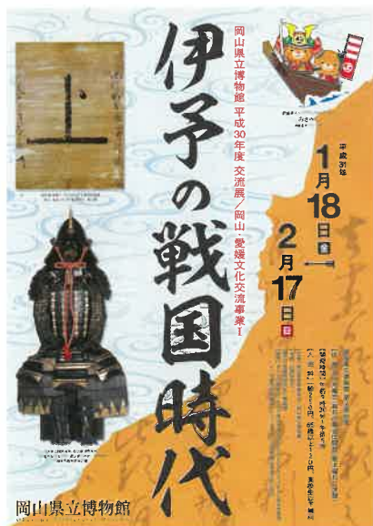
展覧会広報チラシ