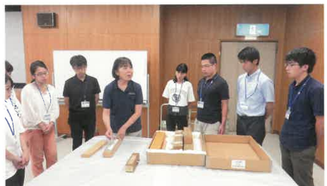
美術資料の取り扱い

学芸員資格の取得をめざす県内外の大学生16人が、当館での実習に参加しました。台風の影響などにより、やや変則的な日程となりましたが、文化財の取り扱いや博物館行事の支援、展示替えの体験などに取り組みました。