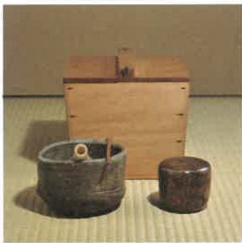
蔦蒔絵大棗 木地釣瓶水指(個人蔵) 備前焼 茶碗 銘只今(岡山後楽園蔵)