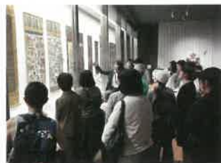
企画展「報恩大師信仰と寺院縁起—四十八ヶ寺を中心に—」展示解説

土曜日の午後2時から、学芸員が展示内容の解説を行っています。展示資料の由来や見どころ、歴史的背景などを分かりやすく説明します。毎回、展示解説を楽しみにされているお客様もおられ、展覧会の内容により関心を持っていただきました。