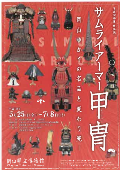
展覧会広報チラシ

日本の甲冑は、武士が合戦において身を守るためのものであると同時に、自らの活躍と存在をアピールするものでもありました。そのため、時代とともに変わる戦い方や新たな武器の登場に対応するなどの機能性はもちろんのこと、人の目を引くことも求められました。