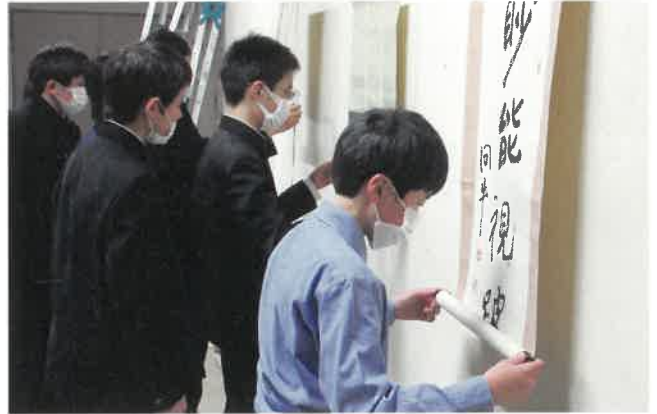
掛け軸の取り扱い

8校23人の中学生が参加し、文化財の取り扱いや、受付・看視、そして広報活動などの博物館業務を体験しました。本物の文化財に触れた感動とともに、管理することの大変さや後世に伝えていくことの大切さを学んでくれたことと思います。