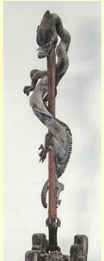
〈企画展「報恩大師信仰と寺院縁起 —四十八ヶ寺を中心に—」より〉 木造 俱利迦羅龍王像 (岡山市 明王寺蔵)