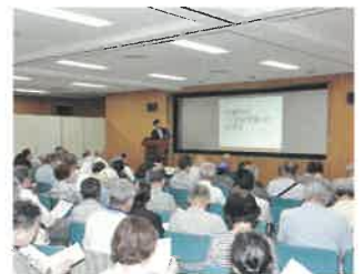
スペシャルコース