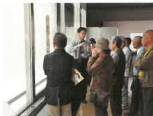
特別展「岡山ゆかりの肖像」展示解説