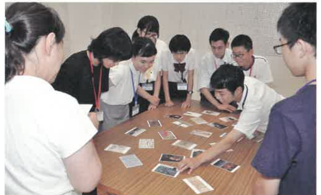
アートカードを使用した鑑賞体験