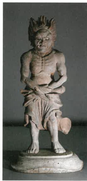
初公開 瀬戸内市指定重要文化財 木造 夜叉神形立像 (瀬戸内市 大賀島寺蔵)