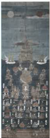
絹本着色 絵曼荼羅 (吉備中央町 妙本寺蔵)

交流展 岡山・愛媛文化交流事業Ⅱ 「正岡子規と仲間たち」 会期 2020年1月1日(水)～2月9日(日)