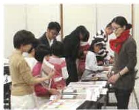
コラージュ de 肖像画