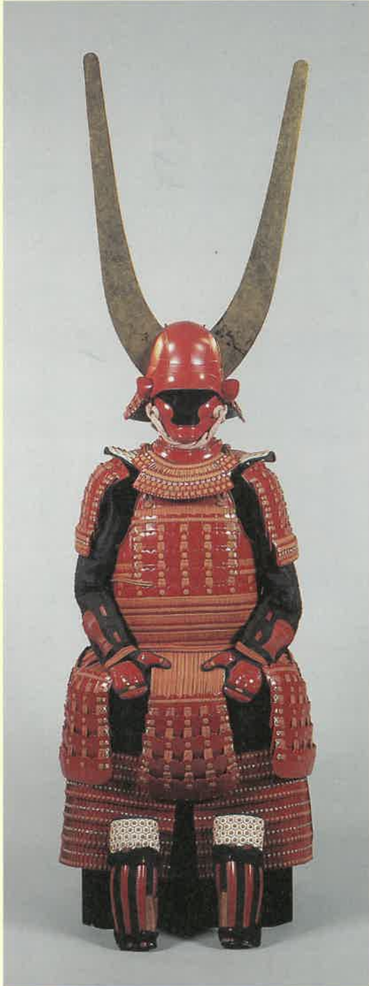
〈特別展「サムライアーマー甲冑 —岡山ゆかりの名品と変わり兜—」より〉 滋賀県指定有形文化財 朱漆塗紅糸威縫延腰取二枚胴具足 井伊直弼所用 (彦根城博物館蔵)