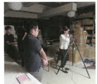
文化財の写真撮影

学芸員資格の取得をめざす県内外の大学生16人が、当館での実習に参加しました。台風の影響などにより、やや変則的な日程となりましたが、文化財の取り扱いや博物館行事の支援、展示替えの体験などに取り組みました。