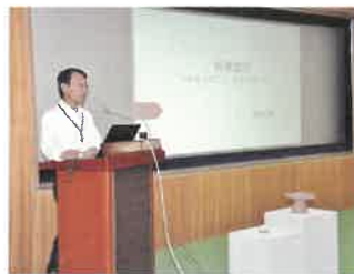
スタンダードコース

人が受講しました。後者は、各研究分野の第一人者による講座で、全4講座（7月～10月）を112人が受講しました。