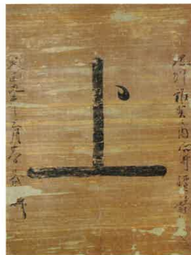
過所旗(複製) 今治市村上水軍博物館蔵 原品：重要文化財 天正9(1581)年 (個人蔵)

伊予の戦国時代に活躍した武将の中に、「日本最大の海賊」と呼ばれる村上海賊がいました。彼らは瀬戸内海に設けた関を通る船に対して、通行料を取るかわりに安全な航行を保障しました。ここでは過所旗と呼ばれる通行許可書や、当時の彼らの動向が分かる古文書などを展示しました。