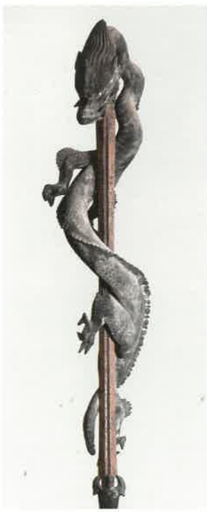
初公開 木造 俱利迦羅龍王像 (岡山市 明王寺蔵)