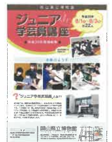
ジュニア学芸員講座報告集

当館では書画、歴史資料、陶磁器、刀剣、民俗資料などの取り扱いを、岡山県立美術館では美術鑑賞について学びました。また、最終日には、参加者自らが講座の様子をまとめた報告集を作成しました。