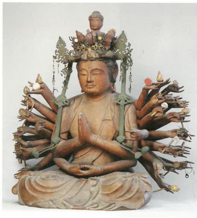
初公開(秘仏) 岡山県指定重要文化財 木造 千手観音菩薩坐像 (岡山市 慈眼院蔵)