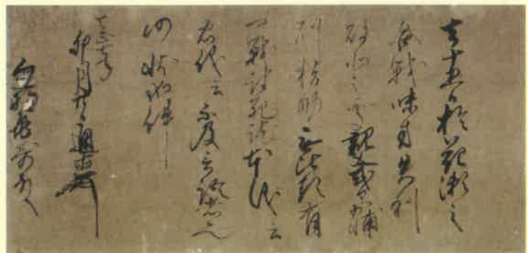
〈交流展「伊予の戦国時代」より〉 河野通直(牛福)感状 天正7(1579)年 (愛媛県歴史文化博物館蔵)