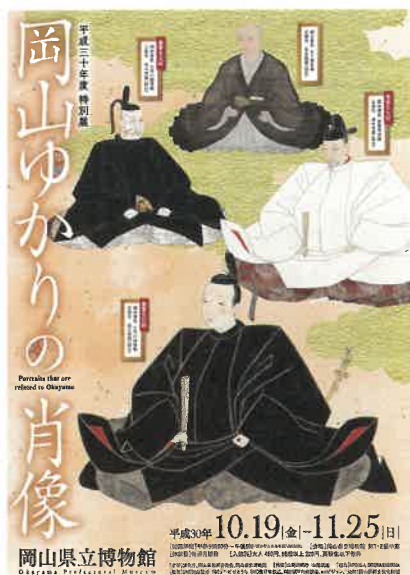
展覧会広報チラシ

大名や武将の肖像を取り上げ、残された情報を丁寧に読み取り、人物の最新研究とともに紹介しました。