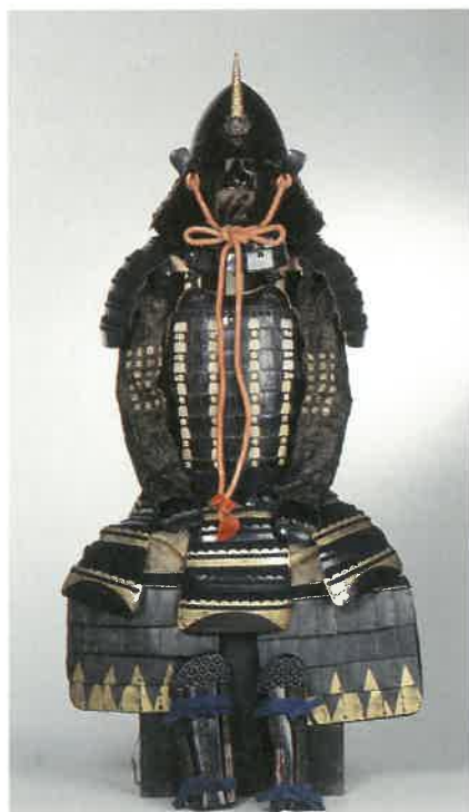
宇和島市指定文化財 紺糸威二枚胴具足 伝土居清良所用 (宇和島市教育委員会蔵)

まず、展覧会の中心となった河野氏は、古代から武士団を形成し、現在の愛媛県中部を中心に勢力を誇った一族です。南北朝時代には、足利尊氏のもとで活躍し、歴代の室町将軍とも良好な関係を築きました。戦国時代には、国内の武将との争いや、大内氏など大名の侵攻の対応に追われますが、約400年に渡って伊予の中でも有力な位置にある名族でした。