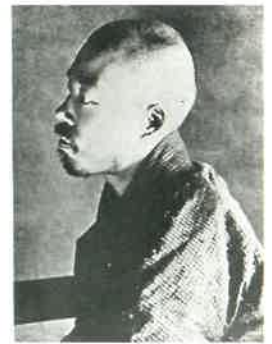
正岡子規