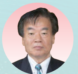
岡山県議会議長 はた ようじ 波多 洋治 〔自民 岡山市北区・加賀郡選出〕

岡山県議会は、県内19の地域から選ばれた55名の議員で構成され、行政に対するチェック機能を果たすとともに、県政における最終的な意思決定機関としての役割を担っております。