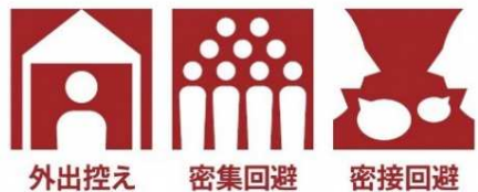
外出控え 密集回避 密接回避