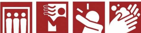
密閉回避 換気 咳エチケット 手洗い