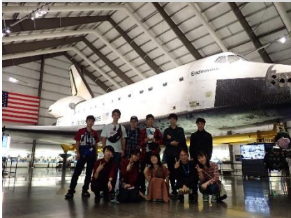
【写真1】 米国海外研修 NASA JPLでの研修