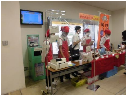
岡山市中区役所での販売活動