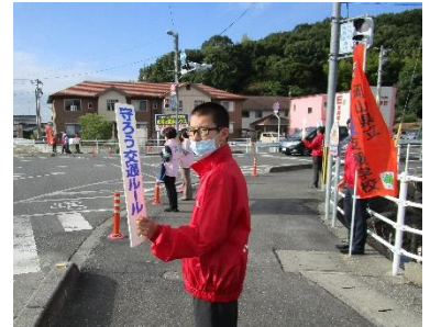
地域の方との交通安全啓発運動

東岡山駅北に位置する本校は、平成9年に開校し、肢体不自由部門と知的障害部門の二つの部門に分かれています。知的障害部門高等部では、作業学習で製作した製品や収穫した農作物を、地域のご協力をいただきながら販売しています。