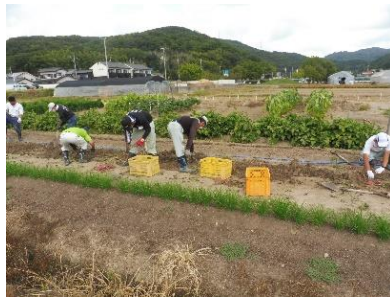
福祉事業所との共同作業