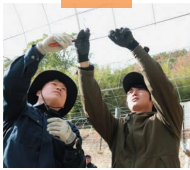
ぶどう棚の設置方法を教わる研修生

就農希望者を対象に、相談会を県内外で開催したほか、先進農家等での農業体験研修や、2年以内の就農に向けた実践的な研修などに取り組みました。