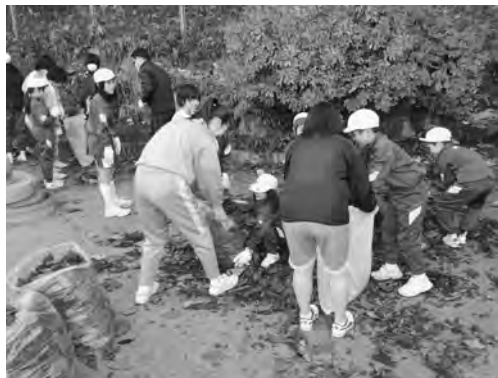
小中合同ボランティアの一場面

ています。地域ボランティアの方々にも参加していただき、また、幼稚園にも出向き園児と一緒に園庭の清掃を行っています。