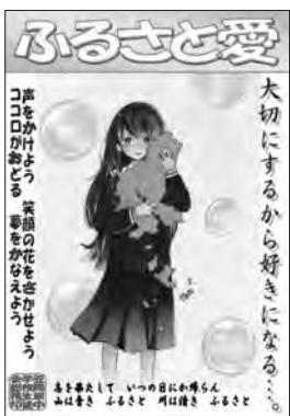
「すこやか月目標」ポスター(8月)