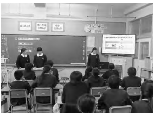
小学校でのSNS出前授業

また、昨年度は校区の小学校で生徒会執行部による6年生を対象とした出前授業を実施しました。事前のアンケート調査に基づいて、ゲームやSNSを利用するときのルールについてグループで話し合いました。ピア・サポートの実践としても、一歩