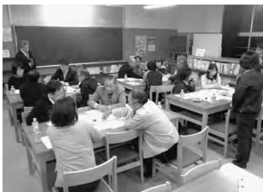
学校運営協議会の一場面