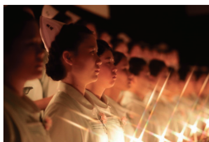
看護科・専攻科 戴帽式

津山東高校には、フィールドワークなど多彩な活動で思考力・判断力やコミュニケーション能力を身に付けられる「普通科」、県内公立高校で唯一卒業と同時に調理師免許が取得できる「食物調理科」、5年一貫教育で地域医療を支える看護師を育成する「看護科・専攻科」、の3つの科があり、それぞれ互いの良さを生かしながら、多様性あふれる前向きな校風を育てています。あなたも津山東高校で、輝く未来を切り拓いてみませんか？