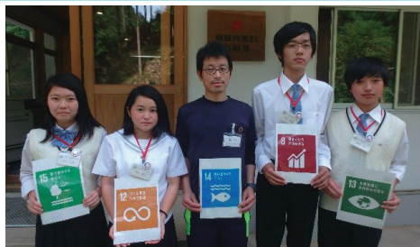
【落合校地】地元メディアと協働して真庭市の企業を訪問。SDGsについてインタビュー。