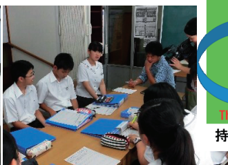
地域に繰り出し、課題を協議