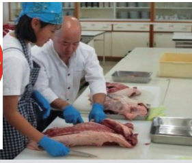
ジビエ料理講習会