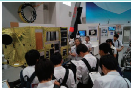
【SSH東京研修】 (JAXA相模原キャンパスにて)