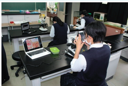
実験方法を事前確認