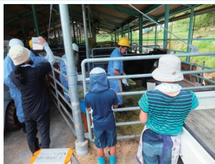
竹チップの牛舎への利用