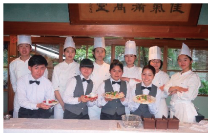
食物調理科 東雲キッチン

津山東高校には、フィールドワークなど多彩な活動で思考力・判断力やコミュニケーション能力を身に付けられる「普通科」、県内公立高校で唯一卒業と同時に調理師免許が取得できる「食物調理科」、5年一貫教育で地域医療を支える看護師を育成する「看護科・専攻科」、の3つの科があり、それぞれ互いの良さを生かしながら、多様性あふれる前向きな校風を育てています。あなたも津山東高校で、輝く未来を切り拓いてみませんか？