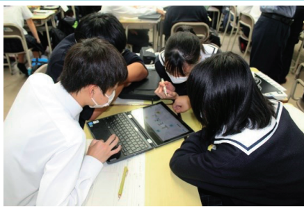
班で考えをまとめ全体発表

林野高校では、生徒が一人1台ノート型PC「Chromebook」を所有し、授業をはじめ、学校生活全般で活用しています。敷地内のWi-Fi整備率は100%で、いつでもどこでも使うことができます。従来の教室とクラウド上の教室を組み合わせせたハイブリッド型授業や、互いに意見を出し合ったり、一つの課題を仕上げたりする協働的な学びの授業など新しい視点での授業づくりで生徒の自主性を育てます。林野高校の最先端の授業を通して、将来必要な主体的に学ぶ力を身に付けましょう。