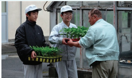
【久世校地】「地域とつながるミニバブリカ」の育苗と提供で持続可能なまちづくり。