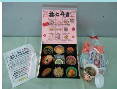
孫心弁当とプレゼント

津山商業高校では「孫心弁当の取組」を実施する中で、商業高校での学びと社会とのつながりを実感できます。