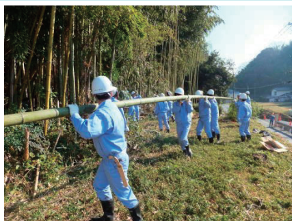
竹の伐採から運び出し