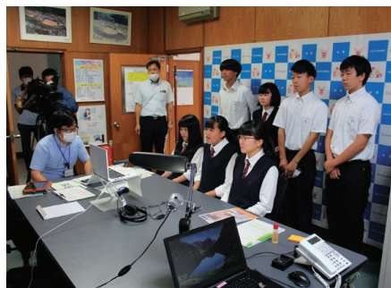
オープンスクール学校説明もオンラインで

林野高校では、生徒が一人1台ノート型PC「Chromebook」を所有し、授業をはじめ、学校生活全般で活用しています。敷地内のWi-Fi整備率は100%で、いつでもどこでも使うことができます。従来の教室とクラウド上の教室を組み合わせせたハイブリッド型授業や、互いに意見を出し合ったり、一つの課題を仕上げたりする協働的な学びの授業など新しい視点での授業づくりで生徒の自主性を育てます。林野高校の最先端の授業を通して、将来必要な主体的に学ぶ力を身に付けましょう。