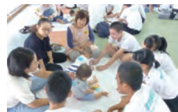
「いのちを育む授業」