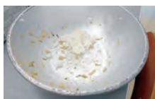
②食缶での残飯回収