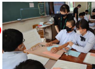
「この表現があるから、魅力が伝わってくるね。」

よりよく魅力を伝えるためには、具体例を付け足し、話す順序を考え、文につながりをもたせるとよい。