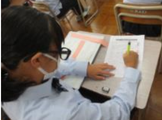
単元の振り返りシートに記述する。