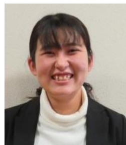
高梁市立津川小学校 教諭

教員になり、大変なことやしんどいこともたくさんありますが、周りの先生方に助けていただきながら、子どもたちの成長をすぐそばで見守ることができるという所にやりがいを感じています。みなさんと一緒に働ける日を楽しみにしています。