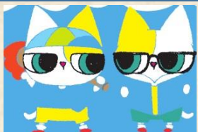
ろんご村の 双子の猫ちゃん

【基礎データ】 人口：31,877人 学校数・児童生徒数： 小学校10校・1,254人 中学校5校・662人 (令和3年5月時点)