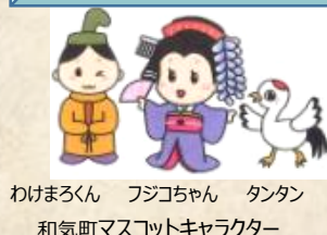
わけまるくん フジコちゃん タンタン 和気町マスコットキャラクター