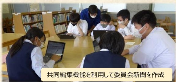
共同編集機能を利用して委員会新聞を作成

和気町では「GIGAスクール構想」の推進に向け、タブレット端末(Chromebook)を整備しました。児童生徒は、授業だけでなく、学校生活の多くの場面で端末を効果的に活用し、他者と協働した学び等を行っています。