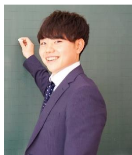
鏡野町立大野小学校 教諭

みなさんとともに夢と希望に満ちた子どもたちの成長を支えていける日を楽しみにしています。