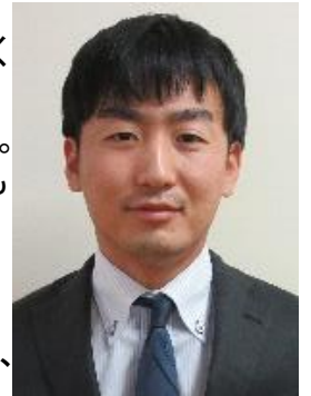
総社市立総社中学校 教諭（教員2年目）