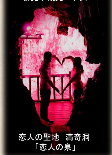
恋人の聖地 満奇洞 「恋人の泉」