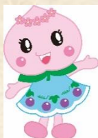
赤磐市マスコットキャラクター あかいいわモモちゃん

【基礎データ】 人口：42,270人 学校数・児童生徒数： 小学校 12校・2,418人 中学校 5校・1,150人 (令和3年5月時点)