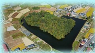
両宮山古墳 (国指定史跡)

数多く残る巨大な古墳や宗教遺跡を巡って歴史や伝説に触れ、古代ロマンに思いを馳せてみませんか。