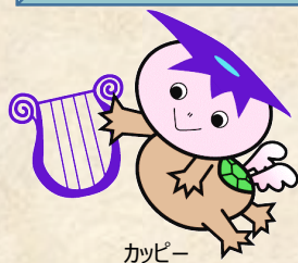
カッピー 久米南町マスコットキャラクター