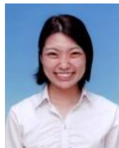
玉野市立荘内中学校 教諭

生徒とともに学び続け、教師としての幸福を感じることができ自然豊かな玉野で、一緒に働けることを楽しみにしています。