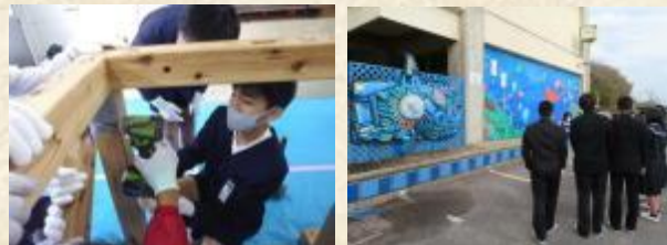
<小学生による職業体験> <豊かな海を守る取組>

地域人材の活用、地元企業との連携で学校の枠に収まらない生きた教育を実践し、「たくましく!まなんでのびる たまのっ子」育成を目指して就学前園から中学校卒業まで、協働教育を推進しています。