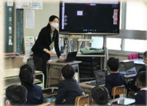
<学習用端末を使用した授業の様子>