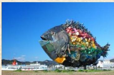
宇野のチヌ/淀川テクニク