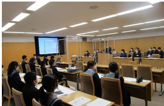
子ども議会～模擬議会で地域提案～

小中学校には、全ての特別支援学級に支援員を配置、業務アシスタントやALT、情報教育支援員も配置。小学校には専科英語教員、小1グッド支援員、登校支援員、高学年は教科担任制を一部導入。中学校には心の教室支援員、 全ての部活動に部活動指導員 を配置し、教材研究や児童生徒と触れ合う時間の確保に努めています。