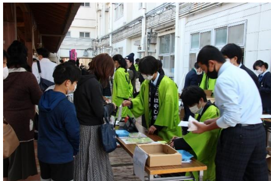
中学校起業体験～商品開発・販売～

「早島町学校教育ビジョン」のもと、「地域とつながり未来を拓く早島っ子」の育成に向けて、「自立・共生・郷土早島を愛する心」を基盤として、15歳の春を見据え、保幼小中の教職員が一体となった取組を進めています。ESDとキャリア教育の視点を踏まえたカリキュラムなど、社会に開かれた特色ある教育課程で子どもたち一人一人の笑顔が輝いています。小中一貫教育を基盤に、「喜んで登校・満足して下校、行きたい・行かせたい学校園」を目指し、協働・協学・協育の町づくりを進めています。