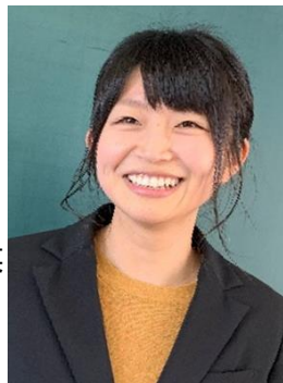
早島町立早島小学校 教諭

子ども達が見せる「できなかったことができるようになった時の表情」それは、何物にも代え難いものがあります。皆さんも私たちと一緒にそんな瞬間に立ち会ってみませんか。早島は夢の宝島。皆さんの若い力と笑顔が子ども達の夢や志をはぐくみます。