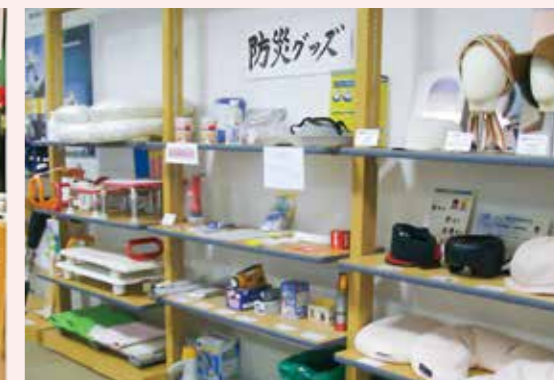
近年、防災意識が高まる中で、障害のある方や、高齢の方が容易に使える防災グッズを展示しています。

上記団体が取り組んでいる事業について各ホームページでも紹介しております。詳しくは裏表紙のURLを入力してご覧ください。