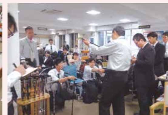
専門相談員のアドバイスを受けられるほか、各種団体等の研修の場としても活用できます。