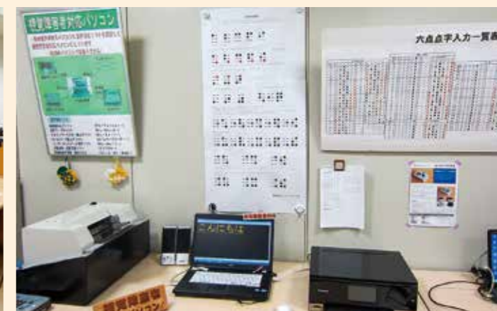
点字の仕組みや点字入力をパネルで紹介し、視覚障害者の方がどのようにIT機器を利用しているのか体験しながら学習できます。