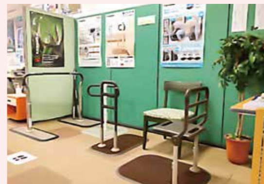
コーナー入り口横の特設スペースで3か月ごとに特定の福祉用具をピックアップして提案しています。