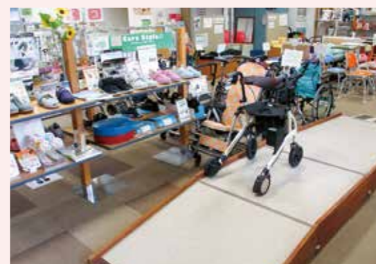
展示している福祉用具を実際に体験使用することができます。