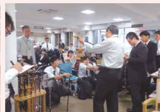
専門相談員のアドバイスを受けられるほか、各種団体等の研修の場としても活用できます。