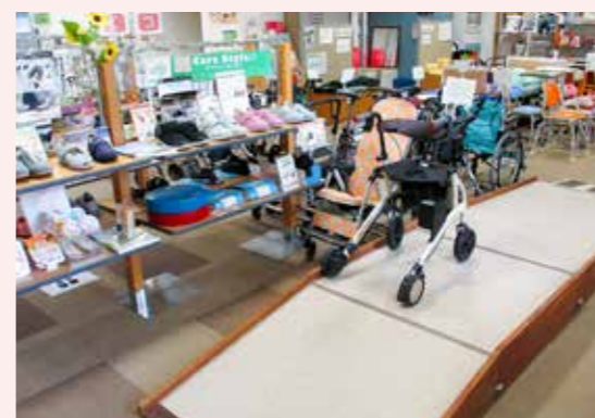
展示している福祉用具を実際に体験使用することができます。