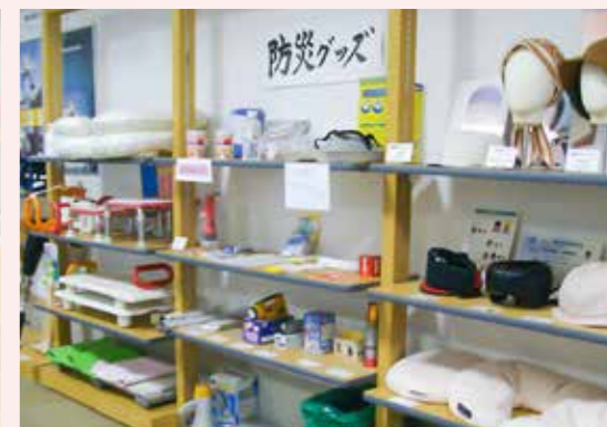
近年、防災意識が高まる中で、障害のある方や、高齢の方が容易に使える防災グッズを展示しています。

上記団体が取り組んでいる事業について各ホームページでも紹介しております。詳しくは裏表紙のURLを入力してご覧ください。