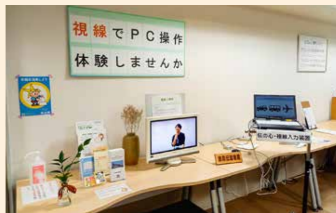
重度障害者用意思伝達装置「伝の心」ではスイッチ操作のほか視線入力装置での操作が体験できます。

各種障害に対応したパソコン周辺機器やソフトなどを展示しています。展示機器については、操作方法などの説明を聞いて実際に体験していただけます。また、IT機器に関する質問や相談、団体見学も受け付けています。