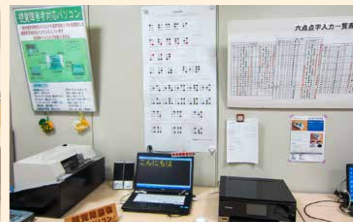
点字の仕組みや点字入力をパネルで紹介し、視覚障害者の方がどのようにIT機器を利用しているのか体験しながら学習できます。