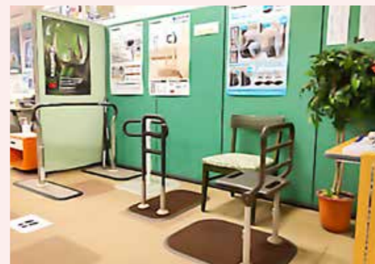
コーナー入り口横の特設スペースで3か月ごとに特定の福祉用具をピックアップして提案しています。