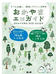
普及啓発用パンフレット