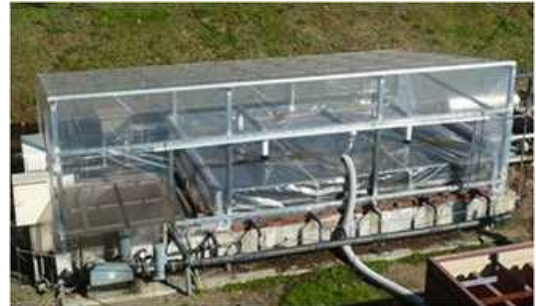
図1 汚水浄化処理施設に設置した排出量測定用チャンバー

そこで、(独)農研機構畜産研究部門と共同で汚水浄化処理施設から排出される一酸化二窒素の排出量を測定するとともに、窒素の硝化・脱窒を促進し、一酸化二窒素の排出が削減できるとされる炭素繊維を担体（微生物が付着）としたリアクター（反応装置）を試作、実証し、年間の一酸化二窒素の削減効果を評価しました。