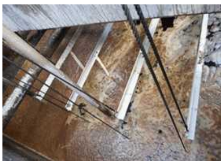
図3 曝気槽内の炭素繊維リアクター