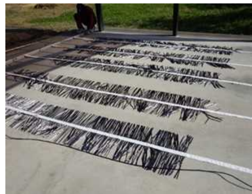
図2 炭素繊維リアクター

養豚汚水浄化処理施設における温室効果ガスの排出量を約80%削減できることが実証されました。また、本技術を全国の家畜尿汚水浄化処理施設に導入できれば、二酸化炭素換算で年間約60万 t の排出量を削減できると試算されました。