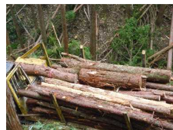
図2 混載された運材車