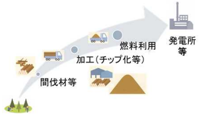
図1 木質バイオマス燃料の利用イメージ

しかし、木質バイオマス燃料は水分が多いと燃焼効率が低下するため、チップ加工前の天然乾燥方法を研究しました。