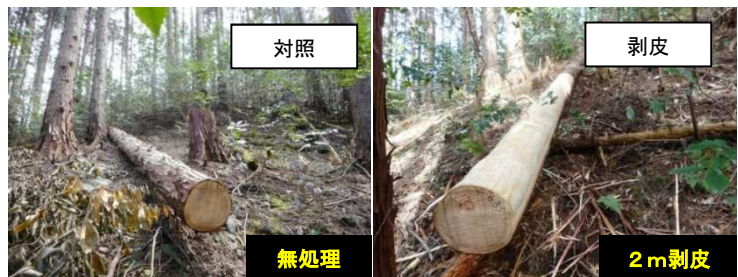
図5 林地での葉付き乾燥試験状況