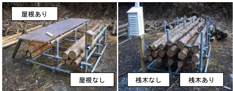
図3 集積土場での試験状況