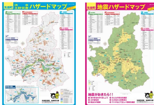
▲ 矢掛町ハザードマップ