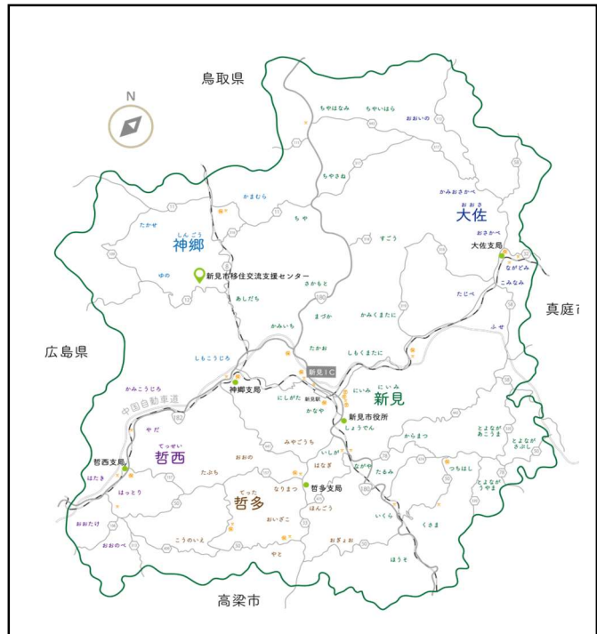
<新見市の面積・人口> (令和3年9月1日現在)

平成17年3月31日、新見市と大佐町、神郷町、哲多町、哲西町が新設合併し、現在の新見市が誕生した。